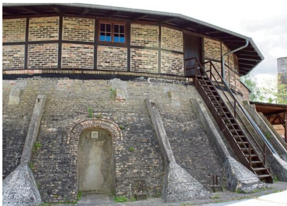
Imposante Zeitzeugen: das "Zehdenicker Ziegeleirevier" lädt zum Staunen ein.