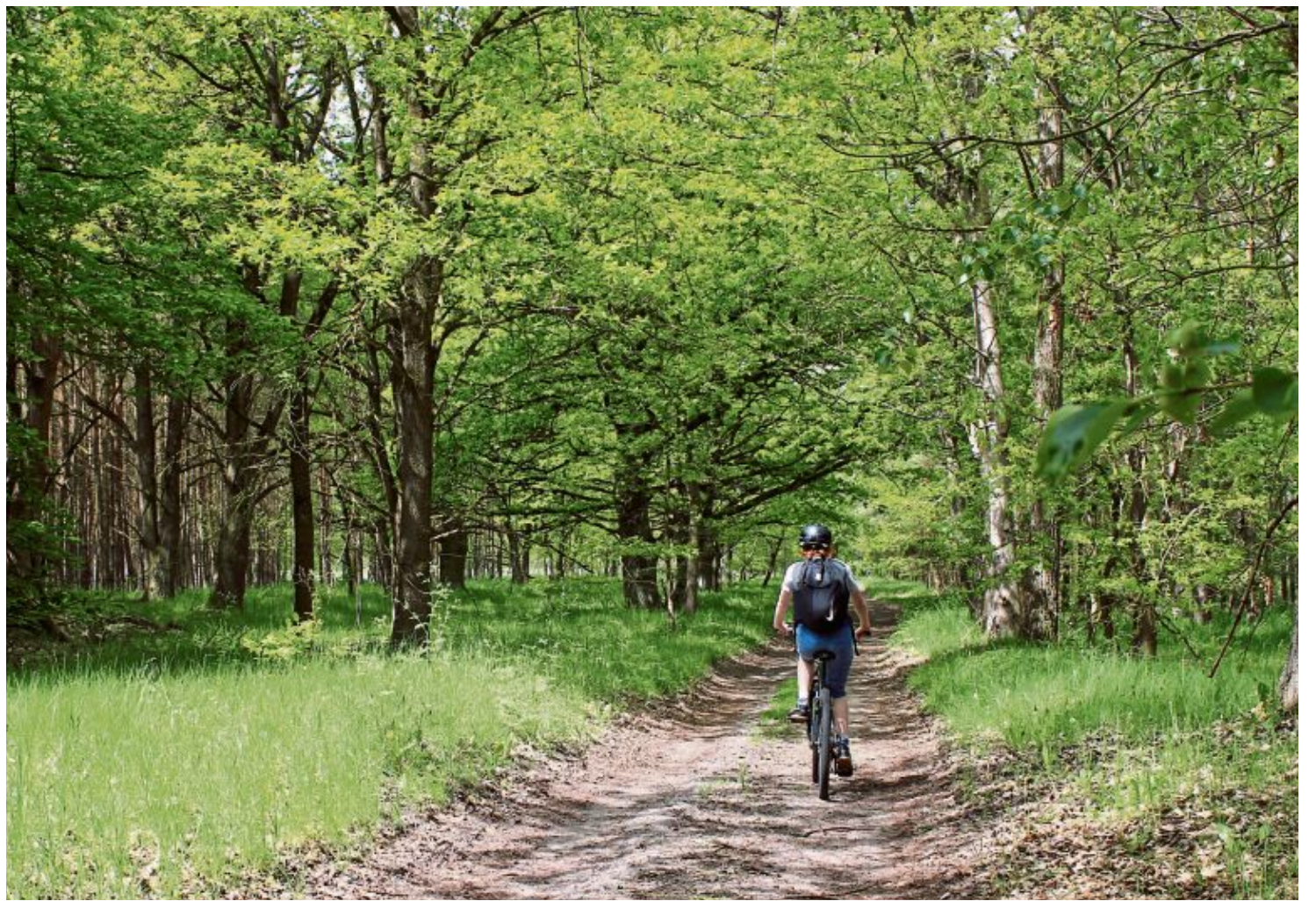
Idyllisch und ruhig sind die Waldwege zwar – etwas Fahrgeschick braucht es aber. Schneller rollt man auf der Landstraße dahin.