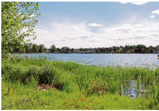
Die Oberhavel ist ein Paradies für Flora und Fauna.